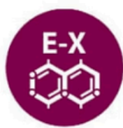
Dióxido de azufre y sulfitos