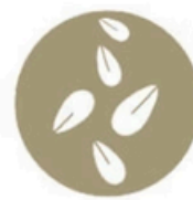
Granos de sèsamo